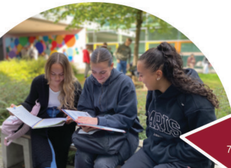
Pausenhof der Abgangsklassen