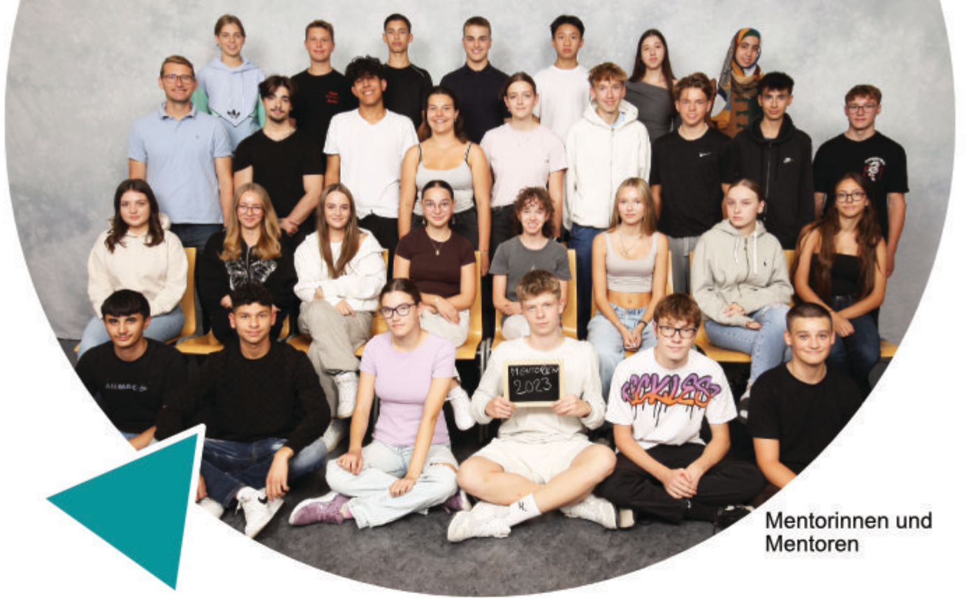
Mentorinnen und Mentoren