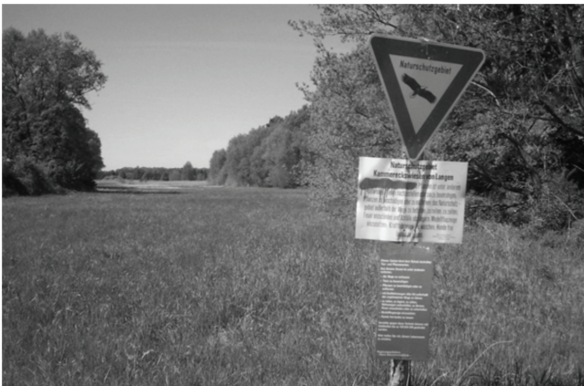
Naturschutzgebiet Kammereckswiesen in der Nähe des Wohngebietes „Im Loh“

Redaktionsteam der Klasse 5aF (Paul Homrighausen u.a.)