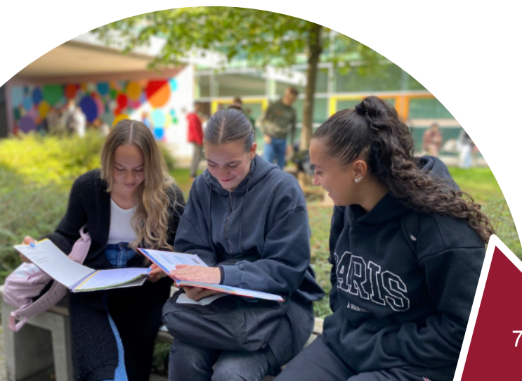
Pausenhof der Abgangsklassen