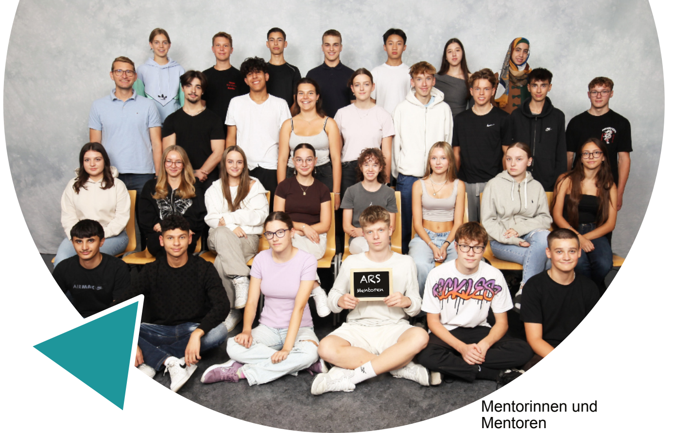
Mentorinnen und Mentoren