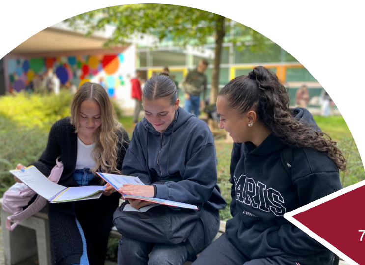
Pausenhof der Abgangsklassen