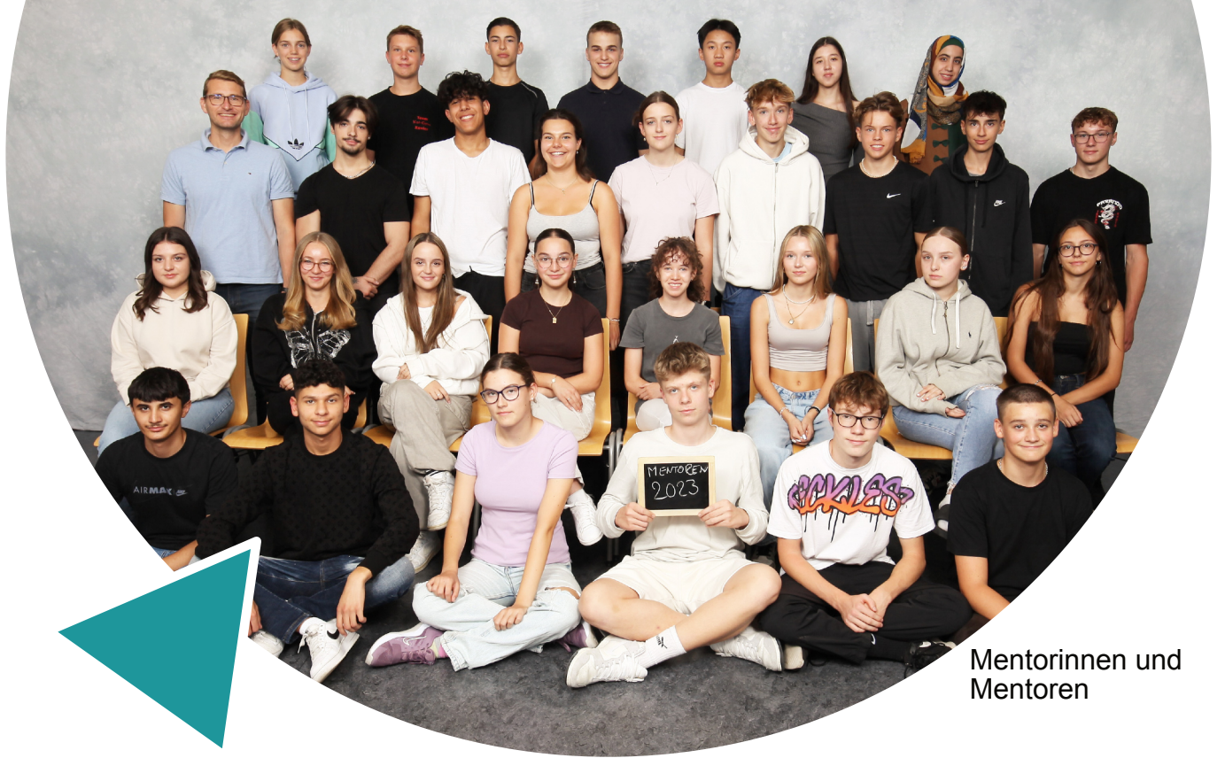
Mentorinnen und Mentoren