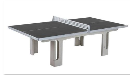
Förderung neue Tischtennisplatte (Außenbereich)