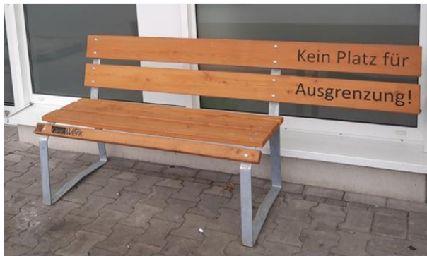
Lebenshilfe Heinsberg die Aktion „Kein Platz für Ausgrenzung“

Förderverein der Adolf-Reichwein-Schule Langen e.V. Kooperative Gesamtschule des Kreises Offenbach