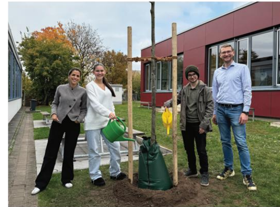
Begrünung des Schulhofes mit der Schülervvertretung